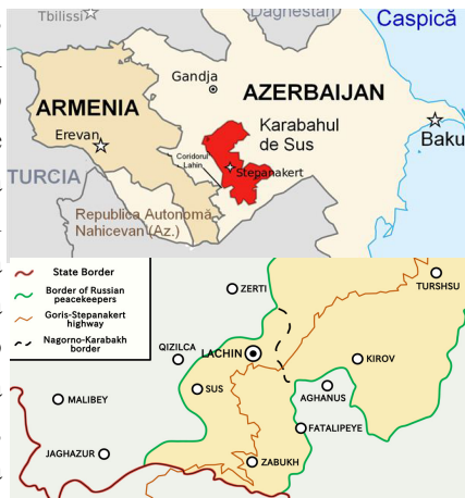
Corredor de Lachin de 5 km de ancho, después del alto el fuego de Nagorno Karabaj de 2020

Los efectos de la invasión rusa de Ucrania repercutieron en otras zonas de lo que fue la antigua Unión Soviética. Después de que la diplomacia de la Unión Europea (UE) pareciera estar logrando resultados positivos para frenar las tensiones entre Armenia y Azerbaiyán, los episodios del pasado mes de septiembre hicieron saltar por los aires las negociaciones. La autoproclamada república de Nagorno-Karabaj, administrada, de facto, por las autoridades locales armenias, estaba bajo la protección de las fuerzas rusas de mantenimiento de la paz, desplegadas en cumplimiento de un acuerdo trilateral de alto el fuego negociado por Rusia. En agosto de 2022, estallaron enfrentamientos en la zona de responsabilidad rusa en torno al corredor de Lachin, que conecta Nagorno Karabaj con Armenia. Rusia culpó a Azerbaiyán del incumplimiento del alto el fuego, al igual que la delegación del Parlamento Europeo, algo notable después de la invasión rusa de Ucrania.