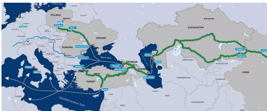
La Ruta Transcaspiana de Transporte Internacional o Corredor del Medio (llamado así para diferenciarlo de otros corredores de la iniciativa "Belt and Road" de China) parte del Sudeste Asiático y China, atraviesa Kazajstán el mar Caspio, Azerbaiyán, Georgia y sigue hasta los países europeos.

Pese a estos obstáculos, la posibilidad de lograr un acuerdo de paz entre Armenia y Azerbaiyán es real. Un acuerdo que mejoraría las comunicaciones de la región en beneficio de millones de personas y permitiría establecer conexiones con la Ruta Transcaspiana de Transporte Internacional hacia Asia Central, que solo se podría realizar con la