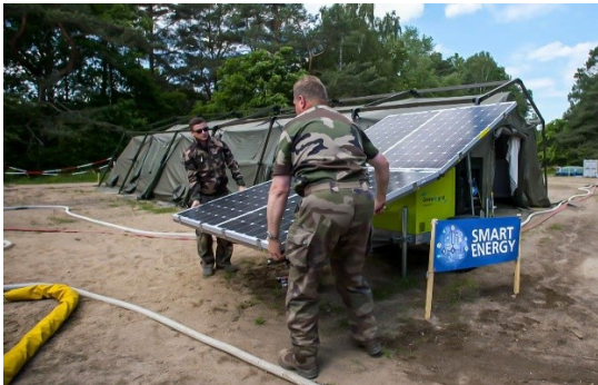
La OTAN prueba tecnologías de energía inteligente en sus esfuerzos por reducir las emisiones. Ejercicio Capable Logistician 2019.

Ya se ha mencionado que para lograr el objetivo de la UE de neutralidad en carbono, es fundamental aprovechar la innovación para mejorar la eficiencia energética del sector de la defensa, incluidas las misiones y operaciones de la PCSD, sin reducir la eficacia operativa. Al contrario de lo que muchos piensan, no existe contradicción entre los esfuerzos de ecologización de las fuerzas armadas y su capacidad para disuadir y defender de manera eficaz. De hecho, la reducción de emisiones, junto con las tecnologías ecológicas, ofrecen ventajas operativas y mejoran la resiliencia.