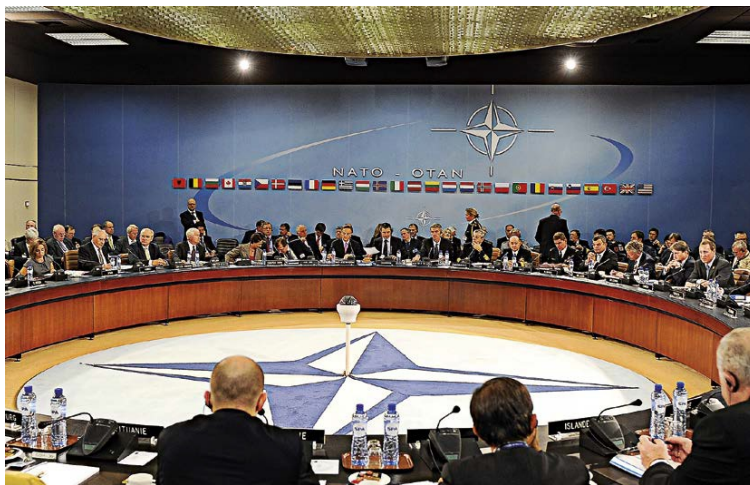
El Consejo del Atlántico Norte es el principal órgano de decisión política de la Organización del Tratado del Atlántico Norte (OTAN). Revista EJÉRCITO